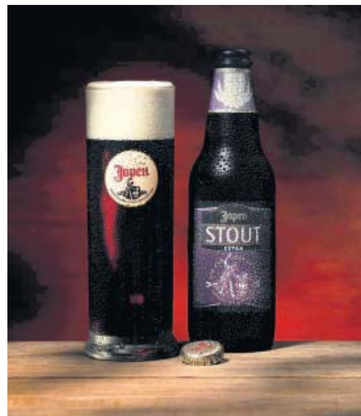
Het gouden Jopen Extra Stout, volgens de jury een bier 'met een fijne schuimkraag, een heerlijk aroma van geroosterde noten en chocoladetoffe, met een intense smaak van geroosterde chocolade en espresso-boon'.

Dat geldt zeker voor het Extra Stout bier, dat door de jury