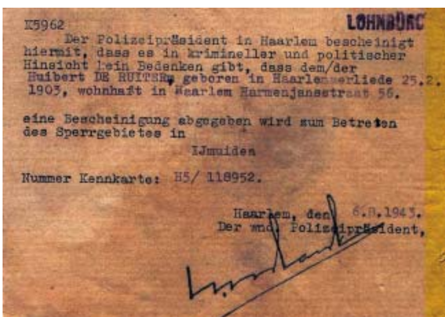
De bezitter hiervan mocht spergebied IJmuiden in.