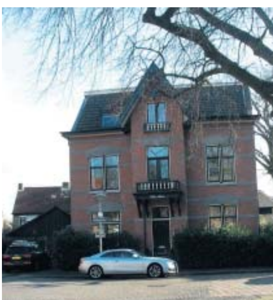
De villa waar de opzienbarende vondst is gedaan.

gen zei: Ik ben met loden schoenen gekomen, maar ga met zwaardere laarzen weg.”