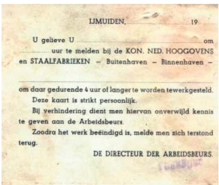
Een tewerkstellingsbriefje van Hoogovens.