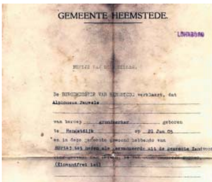
Een bewijs van goed gedrag, afgegeven door Heemstede.